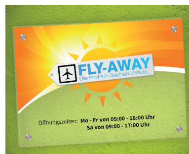
Das Ergebnis: Kräftige Farben und sehr gut lesbare Texte.