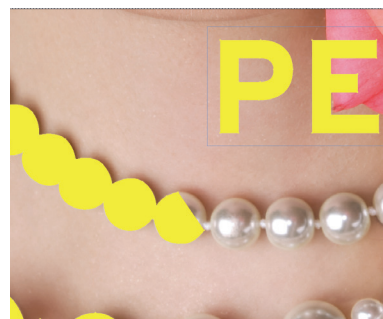
Legen Sie einen Pfad an und füllen Sie ihn mit der Schmuckfarbe Varnish

ACHTUNG: Bei partieller Lackierung von großen Elementen kann es zu Staubeinschlüssen kommen!