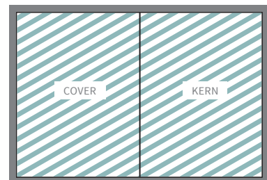
Abb. 2a) Verkürzung der Innenseite berücksichtigt