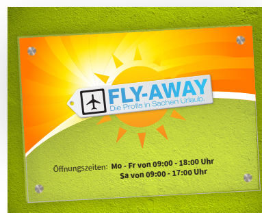
Das Ergebnis: Kräftige Farben und sehr gut lesbare Texte.